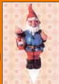
LBS Norddeutsche Landesbauseparkasse