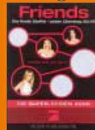
Pro7, SevenOne Intermedia GmbH