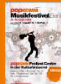
Popkomm Musikfestival 2005