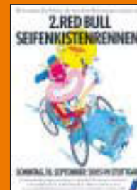
Red Bull Deutschland GmbH