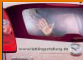
Mazda Motors GmbH