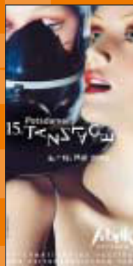
Theater für zeitgenössischen Tanz & neue Musik