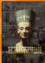
Staatliche Museen zu Berlin