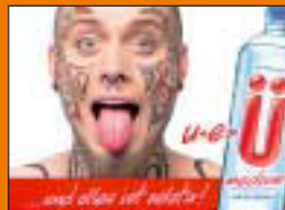
Mineralbrunnen Überlingen-Telach AG