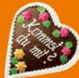
BEG Schienennahverkehr für Bayern