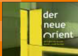
Kulturprojekt der Rheinstädte Bonn, Köln, Düsseldorf, Duisburg